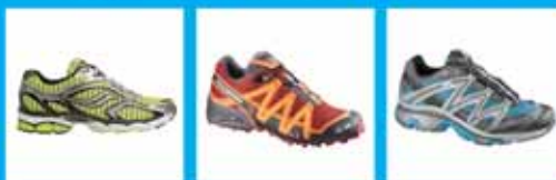
Saucony Triumph 6 Salomon Speedcross 2 Salomon XT Wings GTX

Ya tenemos algunas novedades de calzado de Primavera 2009